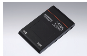
iVDR EX 卡带型

SAFIA: Security Architecture For Intelligent Attachment device